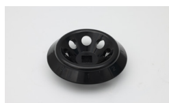
/// 8 孔位转子 规格：8×2.0ml/1.5ml