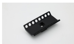
/// 八连排转子 规格：2×8×0.2ml