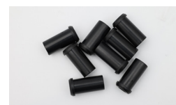
/// 离心管套 规格：0.5ml 离心管套